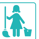
ADDETTI ALLE PULIZIE