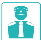
OPERAI E MANUTENTORI