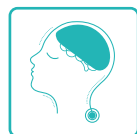
TERAPISTI DELLA NEUROPSICOMOTRICITÀ