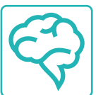
TERAPISTI DELLA RIABILITAZIONE PSICHIATRICA