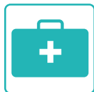
OPERATORI SOCIO-SANITARI (OSS)